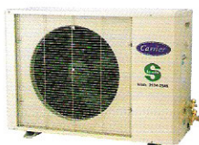
◀ 38RE-G Series

Carrier reserves the right to make changes in specifications without prior notice. บริษัทฯ ขอสงวนสิทธิ์ที่จะเปลี่ยนแปลงรายละเอียดข้างต้น โดยไม่ต้องแจ้งให้ทราบล่วงหน้า