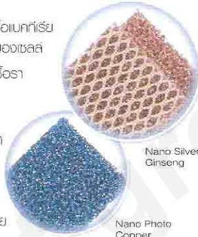
Nano Silver Ginseng