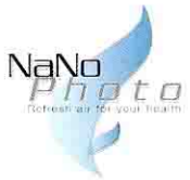
Nano Photo Copper