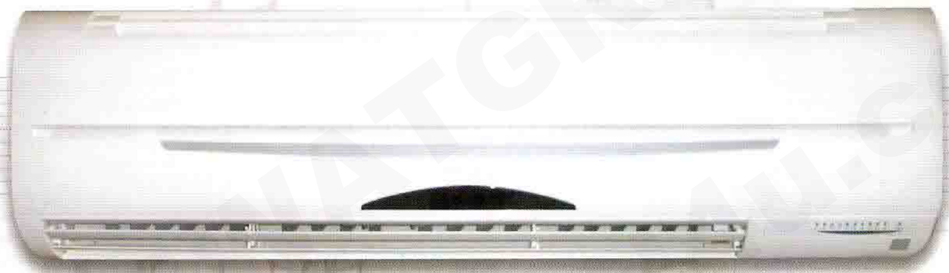
Model : CFW-PF 24