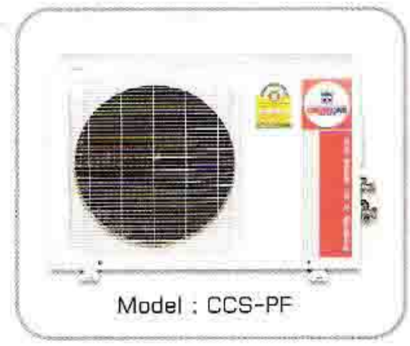
Model : CCS-PF